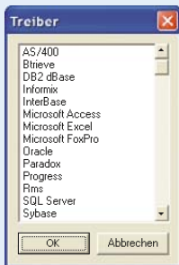
Lesen Sie die Etikettendaten aus verschiedenen Quellen.

BarTender macht den Zugriff auf mehrere Datenbanken und Kalkulationstabellen über ein Netzwerk einfach. Dies umfasst auch Microsoft ODBC- und OLE DB-Unterstützung für Dutzende von Industriestandard- und systemeigenen Datenformaten – sogar Windows-fremde Plattformen wie LINUX, AS/400, Oracle und mehr. Textformate werden ebenfalls unterstützt.