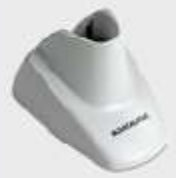
• STD-AUTO-QD24-WH Ständer, Weiß