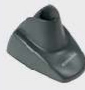
• STD-AUTO-QD24-BK Ständer, Schwarz