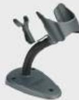
• STD-AUTFLX-QD24-BK Autosense Flex Halter, Schwarz