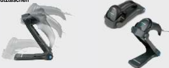
• STD-QW20-BK Ablagen/Schutztaschen, Schwarz